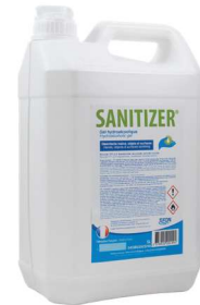
04SB0350SHA BIDON 5L

Utilisez les biocides avec précaution. Avant toute utilisation, lisez l'étiquette et les informations concernant le produit.