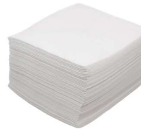
08SHA 12 sachets de 60 formats