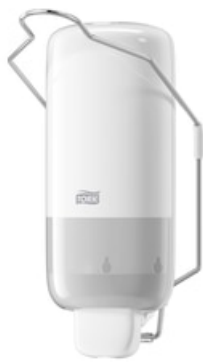
Tork Dist. Levier coude Savon liqu. 560100