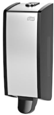
Tork Dist. Savon liquide 452000