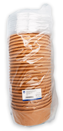
Image du paquet

EL RANGO DE TEMPERATURAS ES PARA LA ENSALADERA, EL RANGO DE LA TAPA ES +40°C/0°C