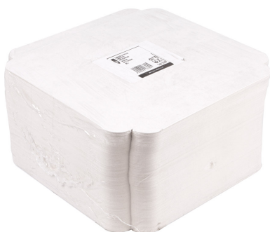
Image du paquet

Règlement (CE) n° 2023/2006 de la Commission du 22 décembre 2006 relatif aux bonnes pratiques de fabrication des matériaux et objets destinés à entrer en contact avec des denrées alimentaires.